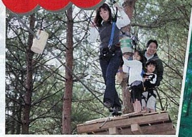
●ツリートレッキングは土・日曜、祝日の10時~日没まで利用可能