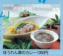
ほうれん草のカレー1050円