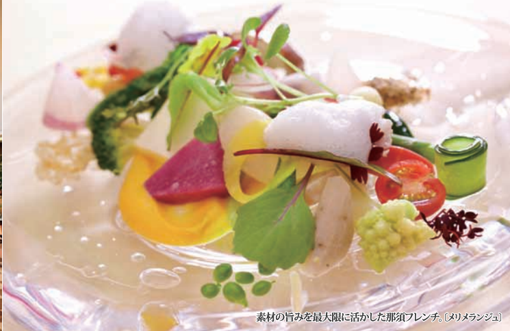
素材の旨みを最大限に活かした那須フレンチ。(メリメランジュ)