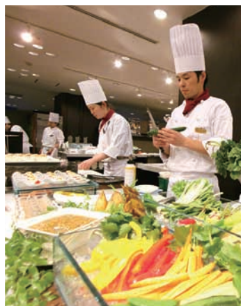
和・洋・中の多彩なメニューが揃うバイキングレストラン。(エルバージュ)