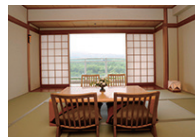
大きな窓から那須高原を望める和室。