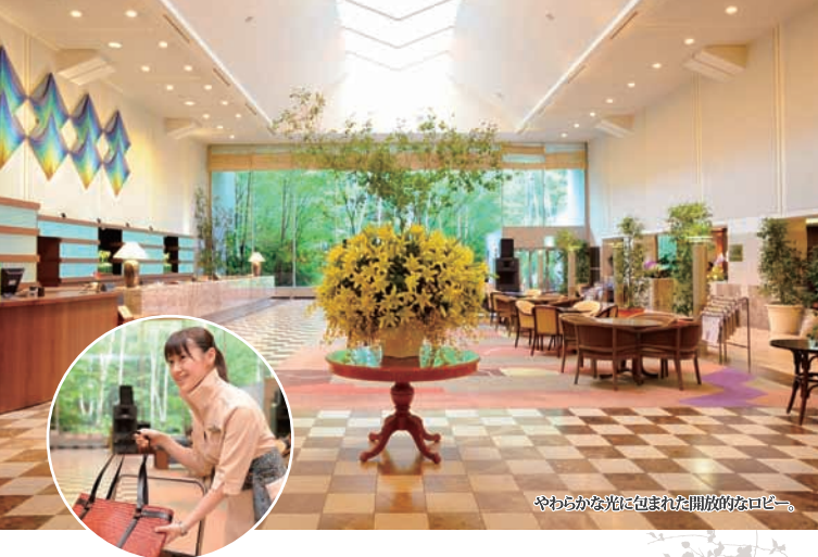
やわらかな光に包まれた開放的なロビー。