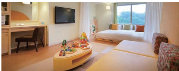
小さなお子様への安全面や衛生面にこだわってつくられたベビールーム。