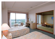
くつろぎの幅が広がる和洋室。