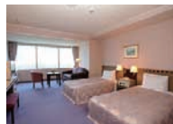
最大面積30㎡とゆとりあるツインルーム。