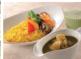
気軽に利用できるカジュアルレストラン。(レモンバーム)